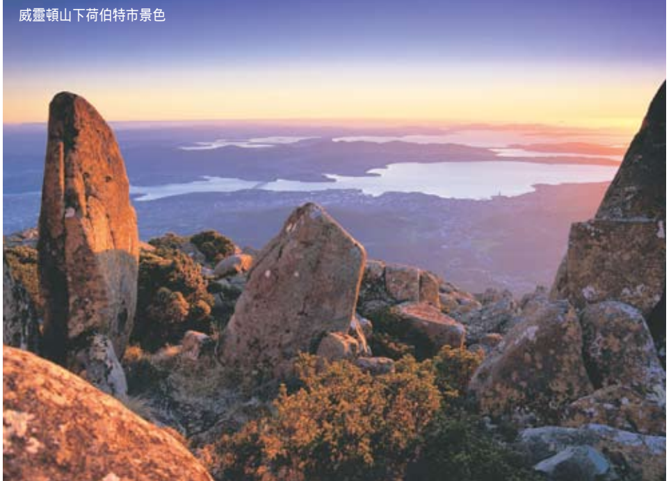
威靈頓山下荷伯特市景色