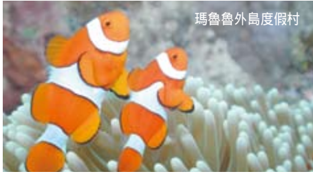
瑪魯魯外島度假村

一，全球五大潛水地之一，這些都是對這個小小的島國的美譽。這裡到處都是土著音樂的舒緩悠揚，空氣中夾雜著熱帶水果的甜美，還有“BULA”、“BULA”的問候語。抵達後獻上傳統花環以示歡迎。隨即前往參觀由好萊塢明星(雷蒙德伯爾)贊助修建的沉睡巨人蘭花園，欣賞各色蘭花，領略熱帶雨林的寧靜安逸。稍後前往有斐濟第一村之稱的維塞塞文化村(Weiseisei Village)，這也是斐濟第一個宣佈為英國殖民地的村莊，也正因此很多維塞塞村的酋長被選為斐濟的總統，而現任總統就是維塞塞村的酋長。英國女王等的外國貴賓訪問斐濟時，一定會到訪此地。遊罷返回南迪市區參觀當地農貿市場，去近距離的體味這個小小島國的特產：香蕉、鳳梨、蕃石榴、木瓜、麵包果、木薯、芋頭以及深受當地人喜愛的一種土酒卡瓦。 午餐於中餐館享用精緻烹飪的海鮮餐。 午餐後入住酒店。辦理完入住手續後自由活動，團友可自由享用酒店的各種娛樂設施。 晚上於酒店享用豐富自助晚餐。