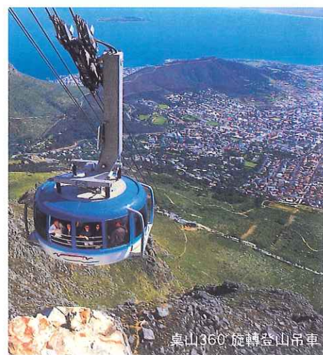
桌山360°旋轉登山吊車